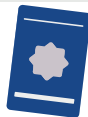
Foto | Qualificação Civil | Todos Os Registros | Páginas De Fgts | Anotações Gerais | Pis